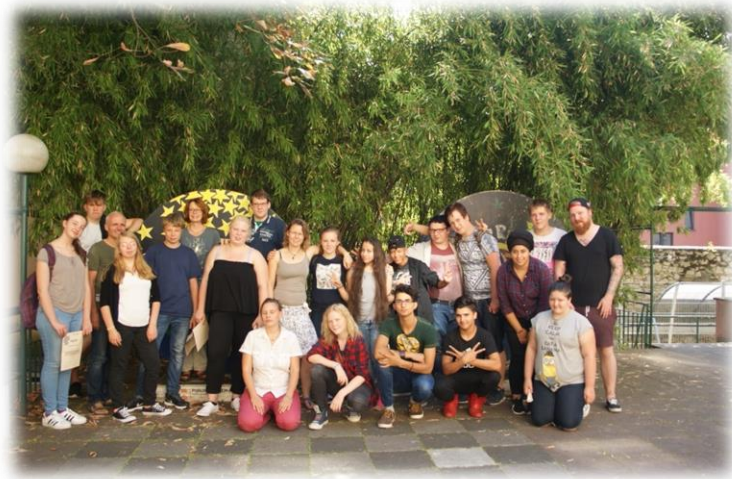
Frankfurt am Main 10.09.2016